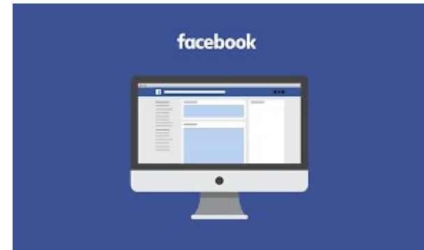
Grupo en Facebook